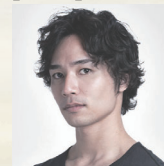
柄本 弾 (東京バレエ団プリンシパル)