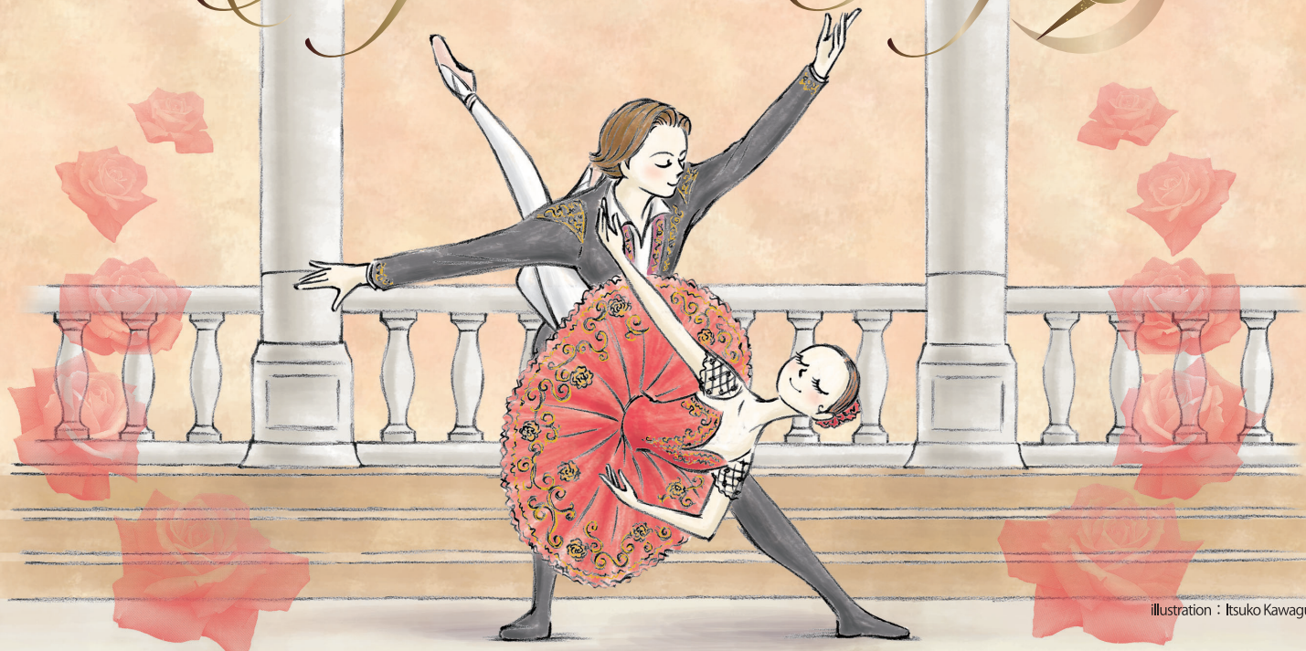
illustration : Itsuko Kawaguchi